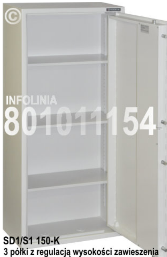
SD1/S1 150-K 3 półki z regulacją wysokości zawieszenia