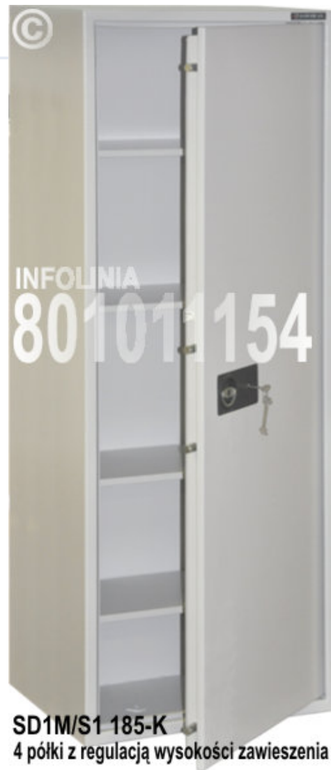
SD1M/S1 185-K 4 półki z regulacją wysokości zawieszenia